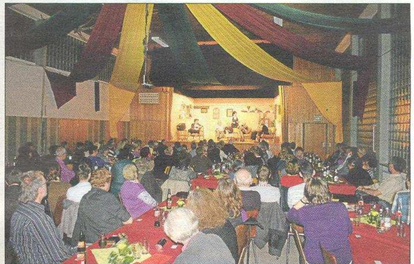
Gut besuchtes "Schneckentheater" in Hausen