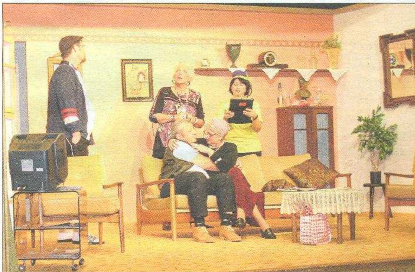
Findet jedes "Häfele sein Deckel?"